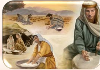
Miracolul zilnic al manei