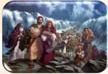
Trecerea Mării Roșii