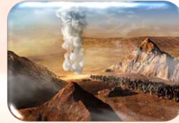
Prezența lui Dumnezeu în stâlpul de foc și nor

Cu toate acestea, la porțile Canaanului, numai Caleb și Iosua aveau credință că Dumnezeu își va ține promisiunea.