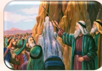
Apa din stâncă