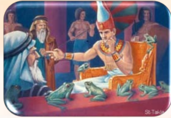
Cele 10 plăgi

Poate că nicio altă generație din istorie nu a fost martoră la atâtea lucrări mărețe din partea lui Dumnezeu. Toți cei care au ieșit din Egipt au văzut: