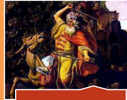
Balaam (v. 15).