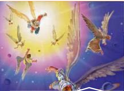
Înșerii care au căzut (v. 4).

Petru compară învățăturile și consecințele învățătorilor falși cu patru exemple din Vechiul Testament: