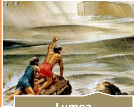
Lumea antediluviană (v. 5).