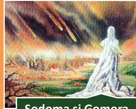
Sodoma și Gomora (v. 6).