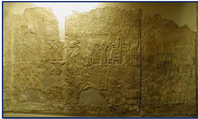
Gravurile descriu distrugerea Lachişului