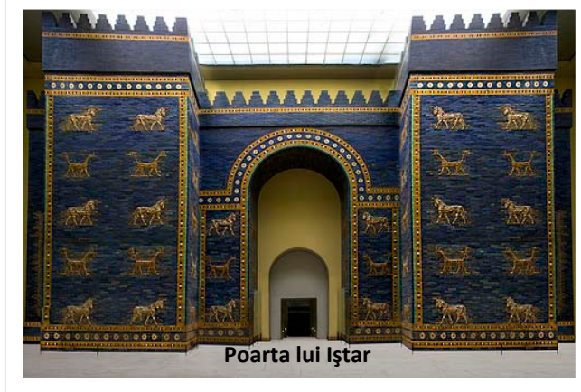
Poarta lui Iştar