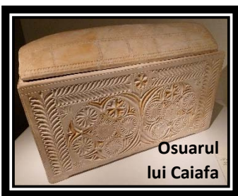
Osuarul lui Caiafa