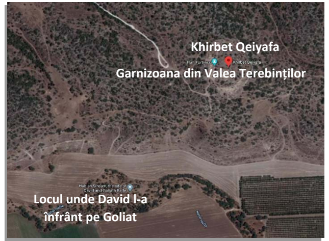
Khirbet Qeiyafa Garnizoana din Valea Terebinților