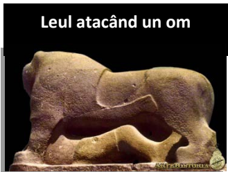
Leul atacând un om