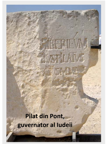
Pilat din Pont, guvernator al Iudeii