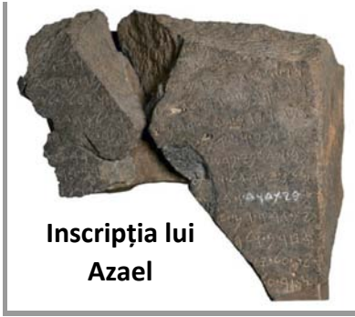
Inscripția lui Azael